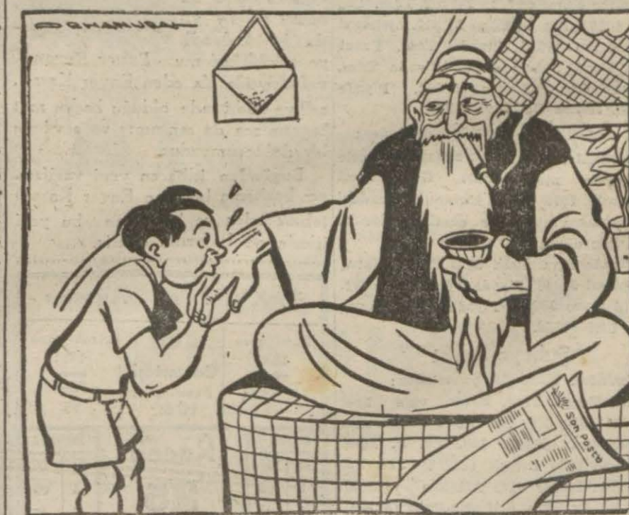
Dillenen bir ailenin aylık kazancı 450 lirayı buluyormuş (Gazetelerden)

— Allah seni kimseye el açtırmasın, yavrum! — Aman büyük babacığım, bana neden inkisar ediyor sun!