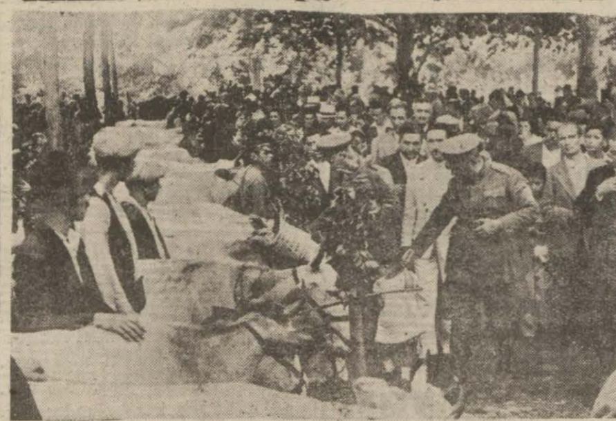
Dünyâ sergiden bir görünüş (Yazısı 5 inci sayfada)